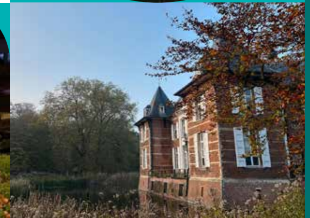
maeskatrien99 Ook al fietsend door de buurgemeenten kon ik de voorbije dagen genieten van vele mooie zichten. Kijk maar even mee!