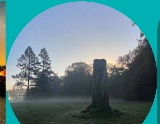
luc_gers #schoten Ochtendstond...