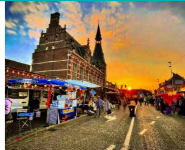
karakoldanvers 🎃👻 Schoten Halloween 2024: Wat een ONVERGETELIJKE avond! 🍷👻

In deze rubriek vind je de leukste foto's van onze Instagrampagina.