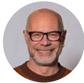
Derde schepen Erik Block Mobiliteit, omgeving & duurzaamheid en personeel