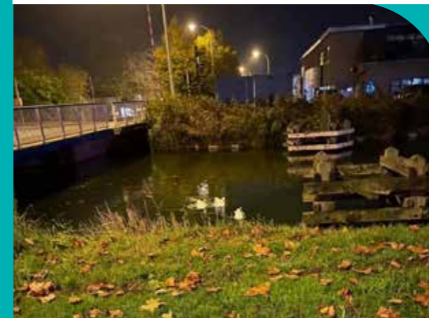
de3ganzenvillersleischoten Wij waren al vroeg op stap, allé op zwem 🏊‍♂️