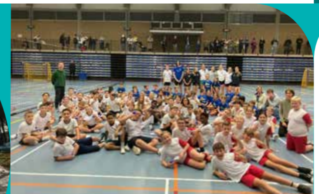
hcschoten Vandaag verwelkomden we de 3e graad van Bloemendaal, Sint-Cordula en Sint-Filippus op ons scholentoernooi. We zagen opnieuw veel blije gezichten en hopen op deze manier kinderen nog beter kennis te laten maken met handbal. 🏐👏