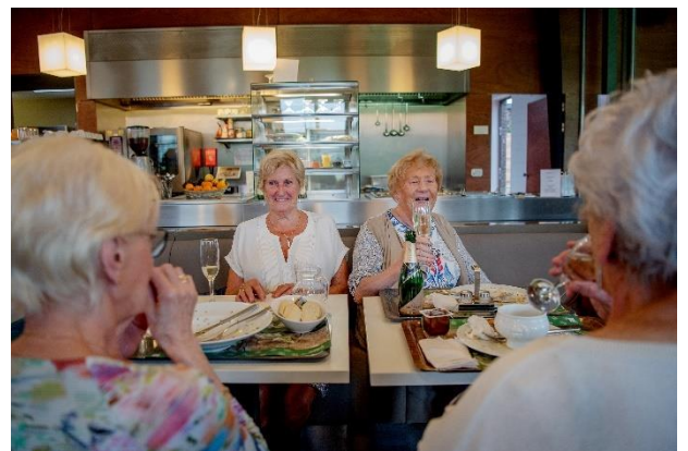
Figuur 12: © Sien Verstraeten – Vlaamse Ouderenraad

→ SAR vraagt om te blijven inzetten op de uitrol en de ondersteuning hiervan voor ouderen. Wij vragen ook de 'prijzen' uit te breiden naar meer dan enkel een koffie in de dienstencentra, denk hierbij aan frisdrank, een warme maaltijd etc. Zet in op bekendmaking en op ondersteuning van verenigingen hierbij.