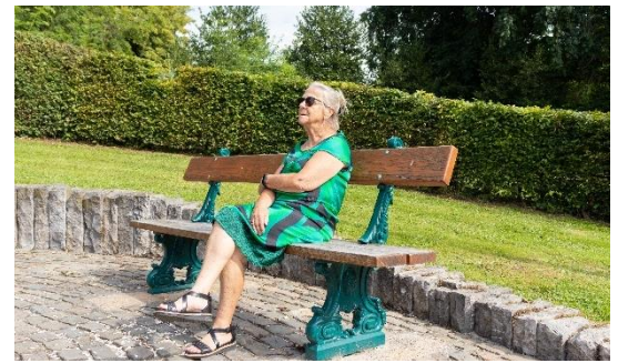
Figuur 9:

→ SAR wenst een mogelijkheid tot financiële toegankelijkheid te installeren bij sportclubs. Denk bijvoorbeeld aan een 'tarief 65+'. De inkomrijzen of lidgelden bij sportclubs liggen hoog (vb. Sportoase). Voorzie ook beweegmogelijkheden in de buitenlucht. Denk hierbij aan toegankelijke wandelroutes, beweegbanken etc. Voorzie ook meer zitbanken langs de prachtige en rustgevende Schoten Vaart zodat ook hier wandelmogelijkheden ontstaan voor minder mobiele personen.