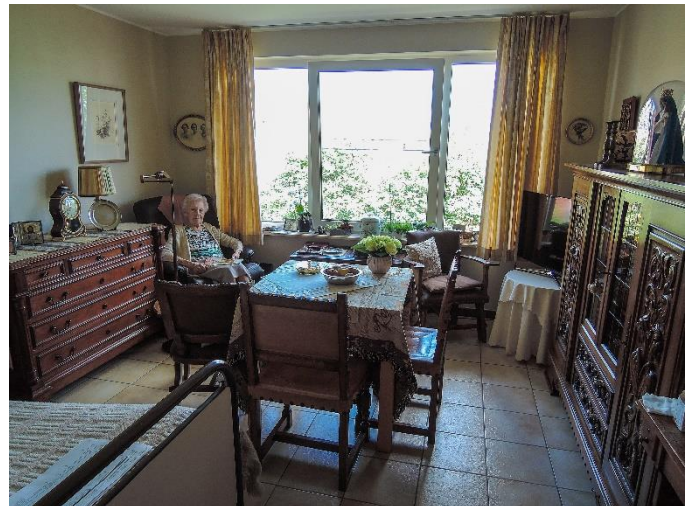
Figuur 15:

– Ondersteun een kwalitatieve en betaalbare woonmarkt, inclusief aangepaste woningen: Zowel op de sociale als private woonmarkt is de kwaliteit van een aanzienlijk deel van de woningen ondermaats en is er een gebrek aan toegankelijke en aangepaste woningen. Bevorder de betaalbaarheid via een voldoende groot aanbod aan aangepaste sociale huurwoningen. Zoek samen met woonmaatschappijen, huurders en verhuurders naar gepaste huisvestingsoplossingen op maat van ouderen met en zonder zorgnoden. Biedt zowel in de private als in de sociale huur ondersteuning voor woningaanpassingen. Ga inventief op zoek naar een optimaal gebruik van het bestaande sociale woonpatrimonium, bijvoorbeeld door te experimenteren met co-housing en kleinere woontiteiten op maat van alleenstaanden.