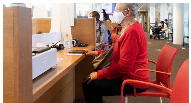
Figuur 16:

– Help ouderen hun energiefactuur te beheersen: Benader ouderen in een kwetsbare financiële situatie proactief, voorzie gerichte informatie en begeleiding, aangepast aan de behoeften van deze doelgroep.