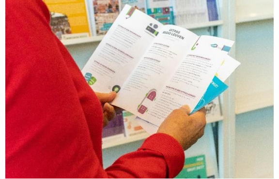
Figuur 17:

→ SAR vraagt de bestaande initiatieven en hun vrijwilligers (schoten senioren computer lessen, computerclub, bib) te ondersteunen, maar organiseer ook actuele cursussen rond bijvoorbeeld It's me. Houd andere prijzen zo laag mogelijk. Maak bekend waar publieke computers beschikbaar staan (dienstencentra, bibliotheek...) die gratis te gebruiken zijn.