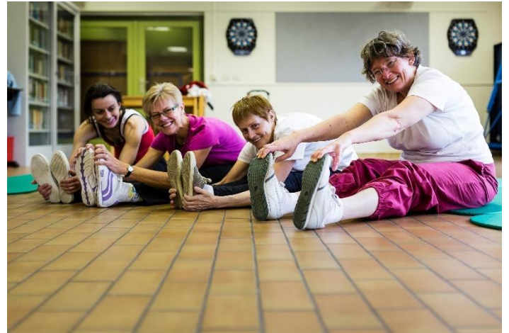
Figuur 10:

→ SAR stelt vast dat er een gebrek is aan ontmoetingsruimtes. Elke wijk zou over een ruime, onderhouden en betaalbare zaal moeten beschikken waar verenigingen hun activiteiten kunnen laten doorgaan en die toegankelijk zijn voor minder mobiele burgers. Investeer ook in de bestaande overleggen tussen SAR, lokaal bestuur en de seniorenverenigingen.