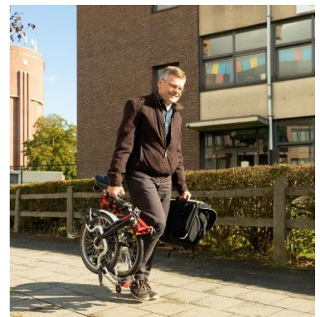
Figuur 7:

→ SAR ziet hier een meerwaarde om met de werkgroep toegankelijkheid van de Raad voor Personen met een Handicap Schoten te blijven samenwerken. Zij vraagt ook uitdrukkelijk om beide adviesraden proactief te betrekken. Bezorg inwoners een overzicht van de openbare toiletten in de gemeente en zorg dat deze onderhouden worden.