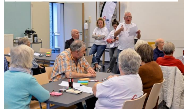
Figuur 3: © Jan Auman