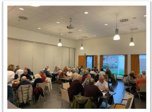
Figuur 2:

Voldoende reden dus voor de politieke partijen, waarvan hun kandidaten op de diverse lijsten bij de komende verkiezingen zullen verschijnen, om rekening te houden met de punten besproken in onderhavig memorandum.