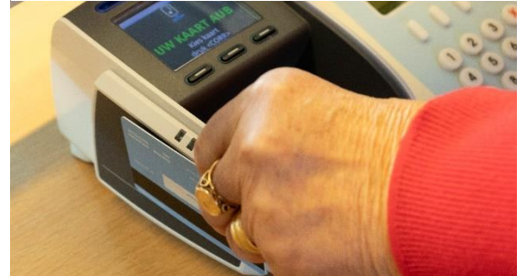
Figuur 18: