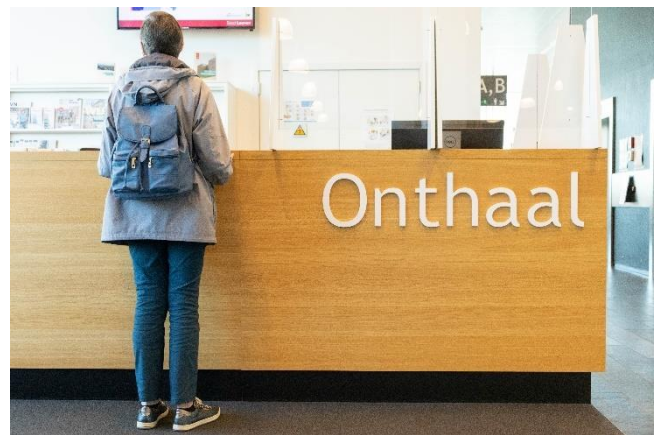
Figuur 14:

→ SAR vraagt een 'meldpunt senioren in nood' te organiseren in samenwerking met de onthaalwerkingen van de dienstencentra en onthaalwerkingen van het gemeentehuis en het Administratief Centrum. Er moet ook digitaal de mogelijkheid zijn om meldingen te bezorgen. Maak duidelijke afspraken met de nodige partners (politie, thuiszorgdiensten etc.).