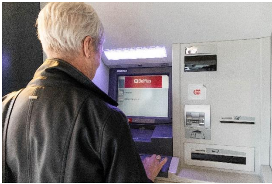
Figuur 8: © Laurane Berkein – Vlaamse Ouderenraad

→ SAR moedigt verschillende proefprojecten van het lokaal bestuur aan en kan hier steeds een ondersteunende rol in bieden. Zij is steeds bereid om samen te werken. We denken hierbij aan de telefonische buurtanalyses, zondagmarkt aan dienstencentrum Cogelshof etc.