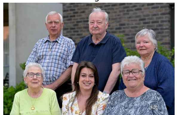
Figuur 6:

→ SAR is zeer tevreden over de huidige onderlinge samenwerking met de ondersteuning van het lokale bestuur en wenst dit in de toekomst zo te onderhouden en liefst nog uit te breiden via de bevoegde schepenen.