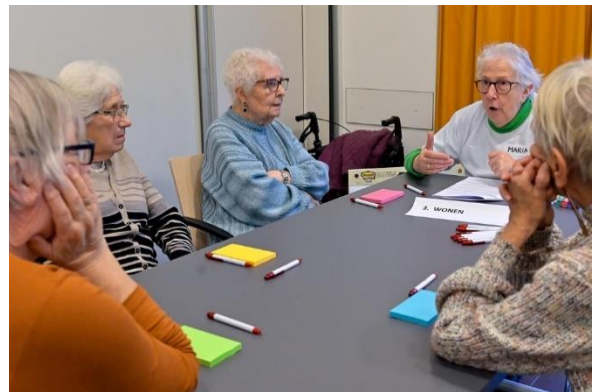
Figuur 5:

→ SAR vraagt daarom toegankelijke stemhokjes, ook in ouderenvoorzieningen. Daarnaast denkt zij aan de dienstencentra, bibliotheek en antennepunten.