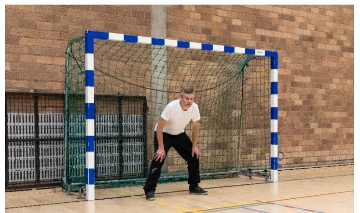
Figuur 11:

→ SAR ondervindt een hoge nood aan extra zitbanken om ouderen en minder mobiele te stimuleren om te bewegen in openlucht. Ook beweegbanken hebben een meerwaarde voor elke generatie. Organiseer initiatievmomenten om het proberen van andere sporten mogelijk te maken. De jaarlijkse Sporteldag is hiervan een mooi voorbeeld.