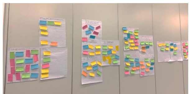
Figuur 4: